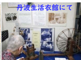
丹波生活衣館にて