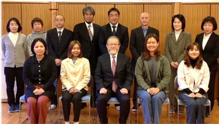
社会福祉法人五十鈴会入社式

社会福祉法人五十鈴会は、今年1月にミャンマーより4名の特定技能外国人を受け入れ、2名がきららに配属されました。職員やご利用者とコミュニケーションをとりながら一生懸命頑張っていますので、どうぞよろしくお願いいたします。